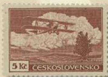
1930, Československo, Letecká 5Kč hr./hl se vzácným zoubkováním. Prokáno za: 100.000 Kč!

DO NAŠICH PRESTIŽNÍCH AUKCÍ PŘIJÍMÁME VZÁCNÉ POŠTOVNÍ ZNÁMKY, AUTOGRAFY, BANKOVKY A VYZNAMENÁNÍ.