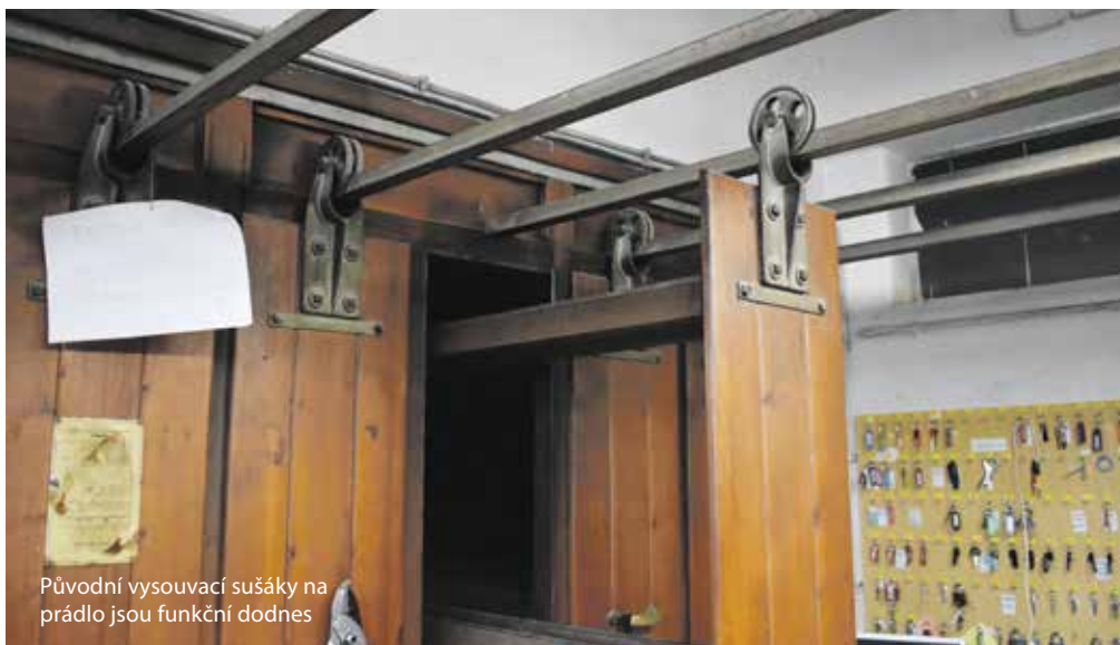
Původní vysouvací sušáky na prádlo jsou funkční dodnes

Promyšlené dispozice a řada technických vymožeností, které nebývají standardem ani u dnešních novostaveb, se nacházely i v jednotlivých bytech. Kromě kuchyně nebo vestavěných skříní tady měli majitelé na chodbách třeba potravinovou skříňku na donášku jídla, byty měly také podlahové vytápění, které bylo v koupelnách dokonce i ve stěnách, a klimatizaci. Každý byt doplňoval balkon nebo zasklená lodžie, včetně garsoniér. Ve vnitrobloku měli nájemníci k dispozici krásnou a rozlehlou zahradu, kde se kromě lehátek nacházel další tenisový kurt. Děti zde měly pískoviště a další atrakce.