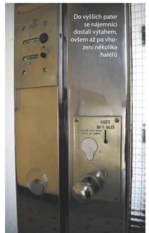
Do vyšších pater se nájemníci dostali výtahem, ovšem až po vhození několika haléřů