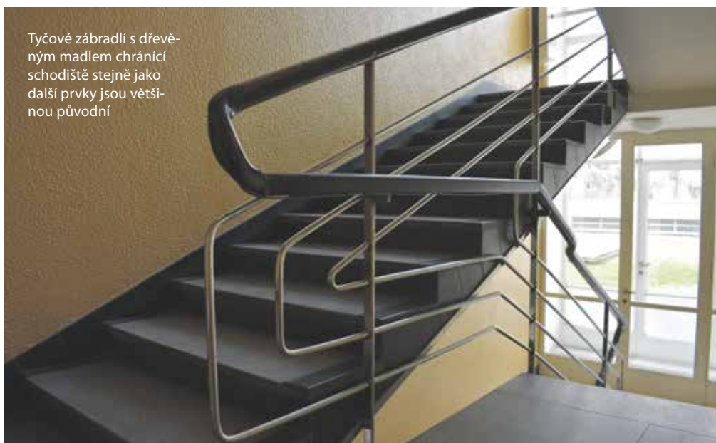
Tyčové zábradlí s dřevěným madlem chrání schodiště stejně jako další prvky jsou větší původní