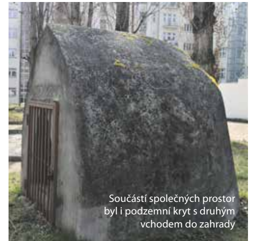
Součástí společných prostor byl i podzemní kryt s druhým vchodem do zahrady