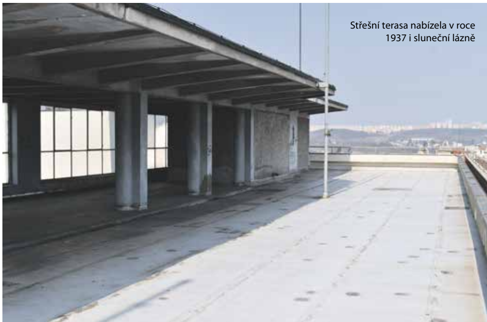
Střešní terasa nabízela v roce 1937 i sluneční lázně

se schylovalo k válce, je součástí společných prostor i podzemní kryt, do nějž se vešli všichni nájemníci. Pro případ zavalení měl druhý vchod, který vedl doprostřed zahrady.