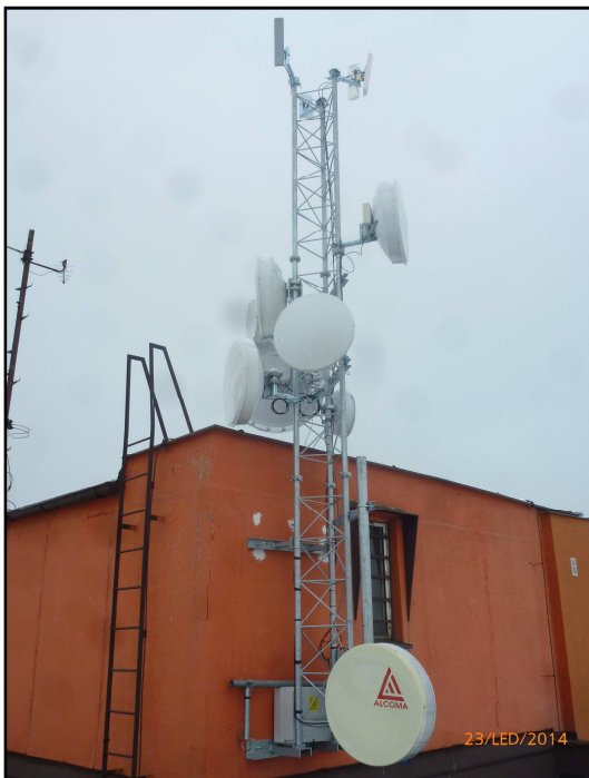
Podoba vysílače po dvou letech provozu