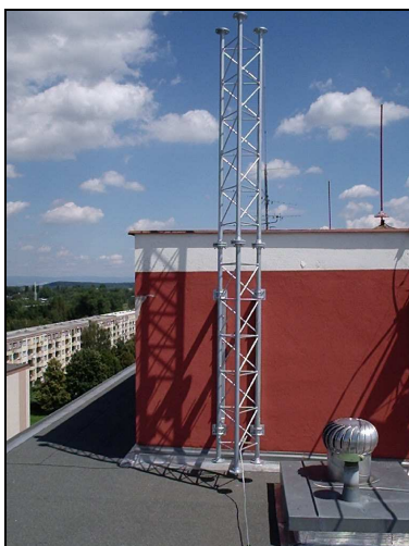
b) podoba obdobného Převaděče cca po 2 letech provozu